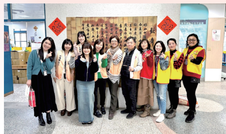
台積電各廠區同仁代表和可愛蛇蛇對聯開心大合照。