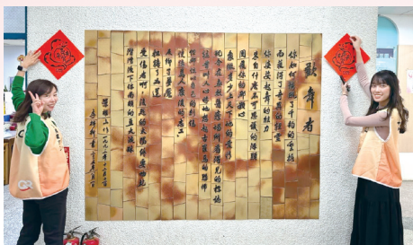
台積電同仁將龍龍春聯更換為可愛的蛇蛇對聯。