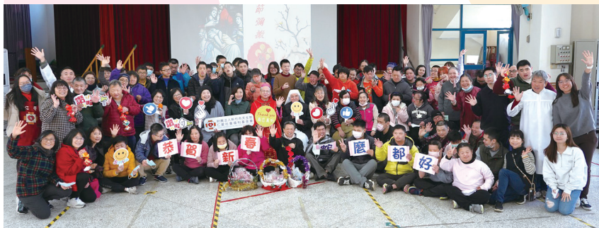
感恩新春彌撒後，歡樂大合照。

教宗方濟各一宣告 2025 年禧年，願我們的生活充滿希望的力量。在這新的一年開始，李主教勉勵我們，可以靜心想一想，要如何陪伴身心障礙朋友？如何提升服務品質？我們也可以效法耶穌的榜樣，讓自己成為他人的陪伴者，每天一步一腳印，大家攜手同行，傳遞愛和希望。