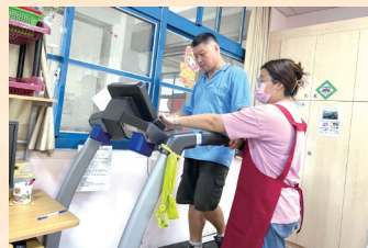
教保員欣柔 (右) 協助大雄走跑步機運動。