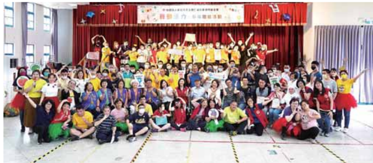
大家開心齊聚一堂，參加【舞動活力 趣味體能活動】展現健康好活力。