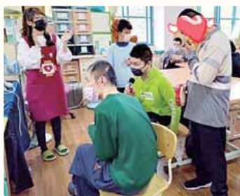
教保員（左一）帶領社團活動，卡啦你就 OK。

無論在薰衣草坊還是鈴蘭坊，我在前輩身上都學到很多，例如對待服務對象的心態、與家屬間的互動溝通，以及讓服務對象在能力範圍內可以自己完成事務……等等，讓我獲益良多，真的很感恩葉由根神父創立這樣一個充滿愛的地方，感恩一群為愛付出的工作人員，更感恩天主，讓愛充滿人間，願所有人都能平安幸福。