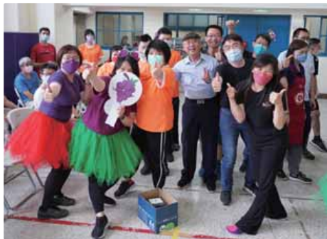
葡萄隊完成「百戰百勝」任務，開心比讚！