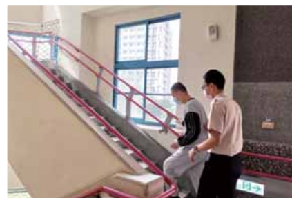
役男諭憑(右)陪同服務對象上下樓梯訓練體能。