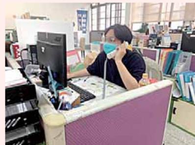
社工使用電話聯繫家屬，關心服務對象近況。

經過早期療育個管中心工作一年的磨練及學習，讓我在自身生活及心靈上都有很大的轉變，能感受到一切都是往好的方向邁進，期許未來自己能夠保持初心繼續努力，有朝一日找尋到自己心目中理想的社工模樣。