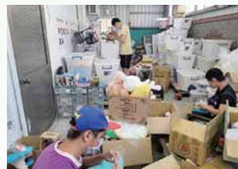
服務對象把來自各界的愛心捐物，整理分類變黃金。

服務對象透過支持漸漸學會捐物整理操作，態度也變得更積極主動，讓我深感喜悅！他們的進步與改變是我服務最大的動力，期許未來能持續提供適切及專業的服務，讓服務對象能有更多的學習和參與。