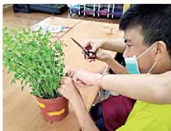
協助服務對象採收豌豆苗。