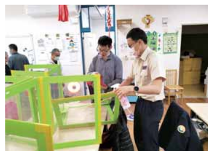
役男諭憑(右)協助服務對象清潔教室。