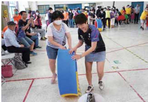
服務對象與愛心單位同心協力，將「超級風火輪」沿者直線推向終點。

感謝天主教天使教堂、台灣應材、高通半導體、譚聖道慈善基金會、五崧捷運、九齊科技、英業達集團公益慈善基金會、建林公益慈善基金會、雲吉資本、沃亞科技、聯電燭光社、建興儲存科技、宜特科技、向前基金會、生生不息教育基金、培生文教基金會、新竹市牙醫師公會、中國國民黨身心障礙者保護基金會、康淳不動產、新竹市陽光仁愛協會及新竹市救急會等愛心單位贊助服務經費及參加活動，支持及陪伴服務對象創造健康快樂的生活。