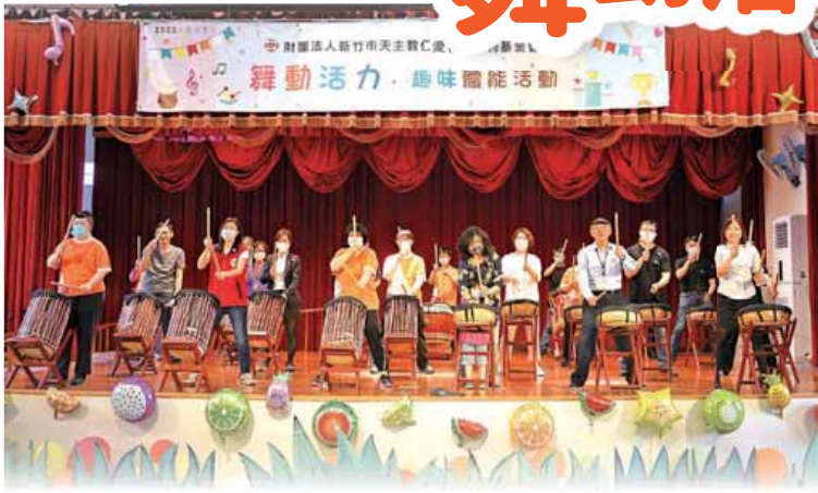
打擊樂坊與愛心單位一起打太鼓互動「心花開」。

體能活動也可以有趣又好玩！仁愛基金會於 5 月 5 日（五）上午舉辦【舞動活力・趣味體能活動】，有太鼓表演和趣味體能活動，展現身心障礙朋友學習成果與健康活力。