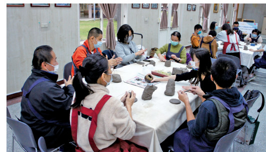
羅氏大藥廠志工陪伴服務對象一起捏陶樂。