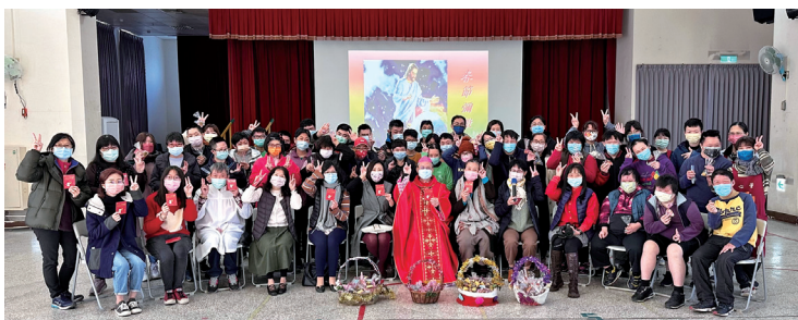
新春感恩彌撒歡聚團聚！

2023年1月31日李克勉主教至新竹仁愛基金會主禮新春感恩彌撒，為服務對象、家長屬、服務人員及捐款人祈禱，祝福大家新的一年平安健康喜樂！