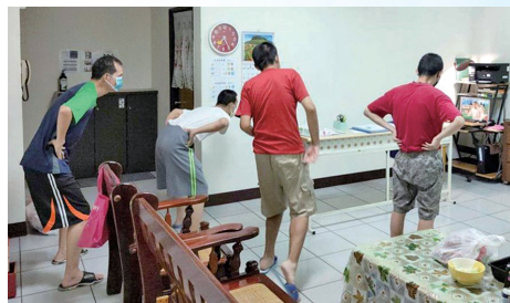
服務對象看電腦影片一起跳健康操。

教保員與服務對象討論可以室內進行的運動項目後，我們設計易讀版競賽說明，讓服務對象了解進行方式，運動項目有「手腳動一動」、「我是大力士」、「仰臥起坐」、「健康操」、「踏步機」等五種，運動後填寫積分表單，每週公告每家累計積分，讓運動在居家生活中就能進行，不必外出找場地；服務對象運動完也會來辦公室分享自己努力運動的狀況，看著每家每週累積的運動分數越來越多，不由得舉起大拇指說讚！