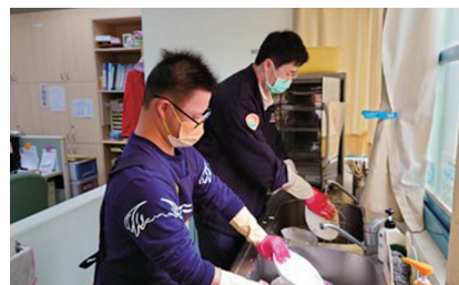
役男浩洛(右)陪伴引導一忠(左)洗碗。