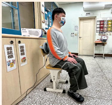
阿修在排演練習後，使用按摩枕來放鬆酸緊的肌肉，是他一大樂事！