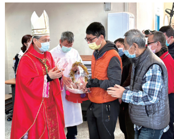
李克勉主教(左1)發給服務對象糖果，祝大家新春快樂。

李主教講道時說：我們要走向純善的道路，與天主相遇，不用擔心掛慮俗世的事物，要提升自己的修養，並相信天主所安排的一切都是美好的，生活中雖然會有驚奇，也會有平安，天主愛我們，我們也要將祂的愛落實在服務中。