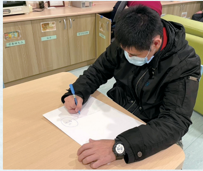
服務對象小楊於夜間休閒時畫圖創作。