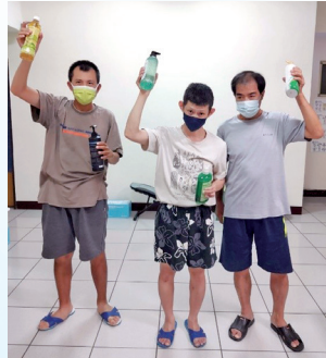
三位服務對象使用未開封沐浴乳、水瓶進行手部上下運動。

經過一個半月的執行，最終由「德馨家園」及「聖彌格爾家園」累積運動次數及分數最高獲勝，除了團體頒獎外，也頒發個人努力獎，並鼓勵所有服務對象繼續在家運動維持身體健康。