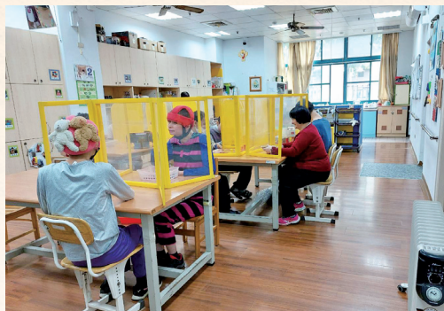
在教室內使用電暖器，可讓身體較虛弱的服務對象維持良好的血液循環，避免失溫所引起的併發症。