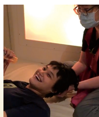
專業團隊齊心介入、協助芳芳揮別不適，現在每天都有開心笑容。

專業團隊立即針對芳芳自傷及傷人的行為進行處理，發現她應是抗議被阻止撞頭才抓人頭髮；為什麼會有撞頭的行為呢？其實這常見於本體覺統合障礙者在舒緩頭部不適時可能出現的行為；解決之道是讓她以安全的方式獲得感覺滿足及舒緩不適，因此團隊為她安排頭部、臉部與背部按摩；