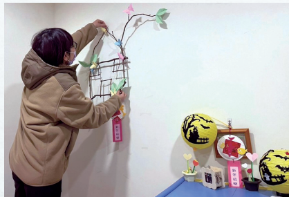
枯枝變身漂亮掛飾佈置房間。

「藝術融入生活、生活創造藝術」，從生活中去體驗美、欣賞美、感受美，並將美的經驗融入生活中，彼此相互影響與交融。