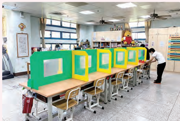
教保員發揮創意，製作防疫隔板。

(希 11:1)：讓我們虔心祈禱，體悟祈禱的力量、於艱難中依然有盼望，大家齊心協力、團結一致，共度難關，並活出平安與喜樂的人生。