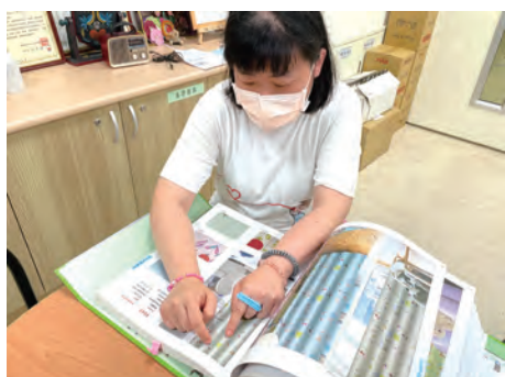
小怡為家園選擇喜歡的窗簾花色。