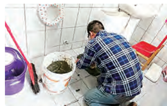
聯電節能服務隊修繕早療教室馬桶漏水問題。

施工完畢後，服務對象進入活動場域，都異口同聲的發出驚呼聲「哇！好亮哦！」，立即感受到這場域的改變，有人說「看白板更清楚」、「教室看起來更明亮了」，大家都很开心。