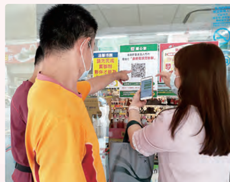
社工帶服務對象到超商認識簡訊實聯制和用手機掃描 QR-Code。