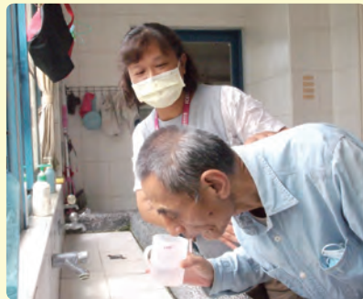
阿柱經過健口操訓練後漱口品質提升。

現在樂活坊的老朋友們臉上顯得更有精神與活力，健口操運動讓大家的臉部變得更有表情，口腔動作改善、漱口動作確實而減少了口腔內的殘渣，連帶也減少了感冒的機率，所以讓我們一起來找健口的樂趣與益處。