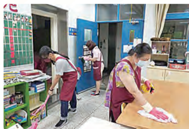
教保員進行教室清潔消毒工作。