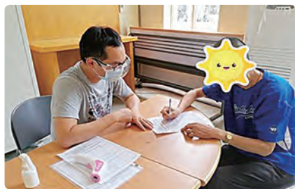
社工支持身心障礙者填寫紓困補助申請表。

早療個管及東區身心障礙社區資源服務的社工夥伴們，為了社區中近千個早期療育及身心障礙家庭，服務的腳步仍舊持續奔忙。早療孩子停課在家，家長需要請假在家照顧，也因疫情影響，部分早療家長以及社區中的身心障礙者可能面臨減班、失業，生活可能陷入困境。因此，社工們以電話訪視方式關懷支持在家辛苦照顧早療孩子的家長們、關心社區中早療家庭及身心障礙者的生活與經濟需求，也適時分享紓困補助相關資訊，甚至協助連結物資資源，以紓緩經濟困境。而針對社區中弱勢的身心障礙者，社工穿戴好防護設備，仍舊進行家訪關懷、贈送飲用水等生活物資及口罩，讓服務對象能在艱困中獲得支持與力量。