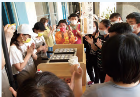
服務對象看著雞蛋糕製作過程，開心地拍手唱歌。