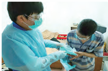
社工至弱勢身心障礙者家庭進行關懷，並贈送口罩等防疫物資。